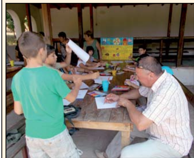
Кметът на с. Крушевец рисува заедно с децата от ЦНСТ-Атия и деца от селото и разказва за историята на Крушевец

ние към противника, в респект към по-силния, към знаещия и можещия“ споделя г-н Иванов. С широк усмивка прегръща децата от ЦНСТ, като показва снимки на своите медалисти. Разказва за своите дъщери и внуци, с които се гордее.