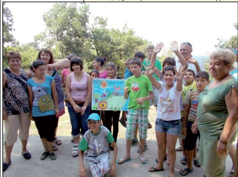
Едно незабравимо преживяване и разходка сред природата запомниха децата от посещението си в с. Крушевец