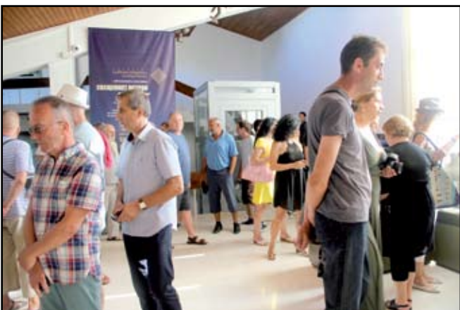
Интересът към изложбата пролича още по време на нейното официално откриване