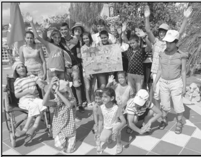
Нови приятелства и много емоции за децата от ЦНСТ в с. Атия и децата от с. Равадиново