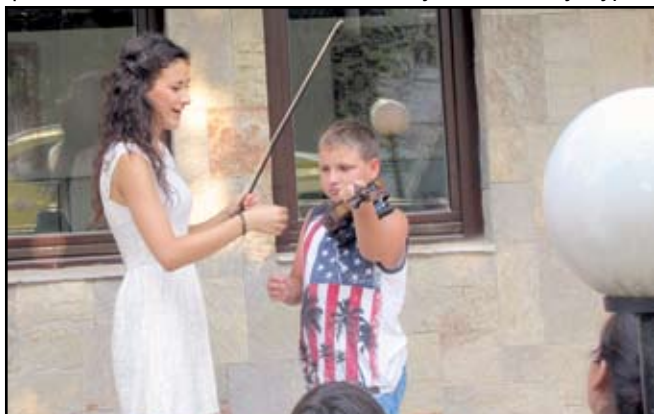
Един бъдещ Паганини се докосва за първи път до цигулка и не крие приятното усещане

Вечерта на сцената пред читалището куклени театрални спектакли канят деца и възрастни, за да се забавляват заедно.